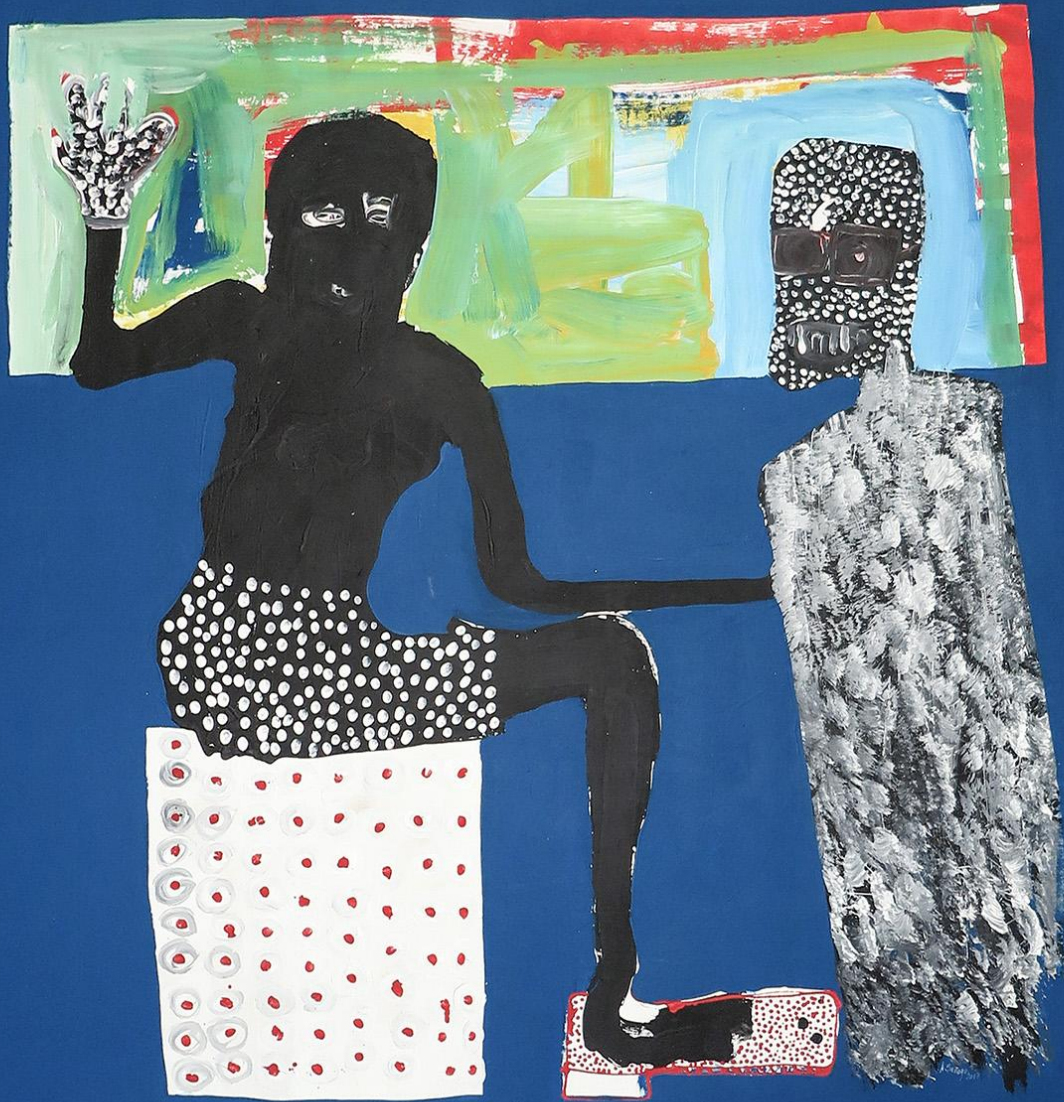
Autoportrait au pluriel, 2017

Acrylique sur toile - Acrylic on canvas, 230 x 230 cm - 90,5 x 90,5 in, © MAGNIN-A