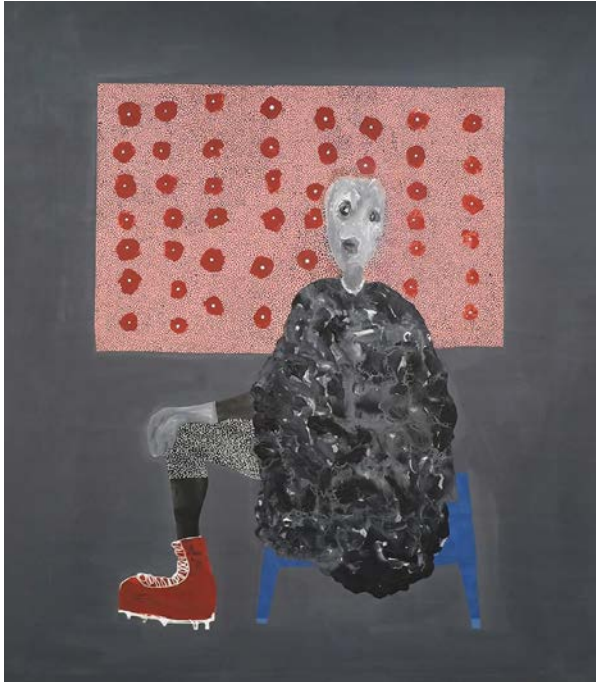
Elle me regarde , 2019 Acrylique sur toile / Acrylic on canvas 208 x 180 cm - 81,9 x 70,9 in