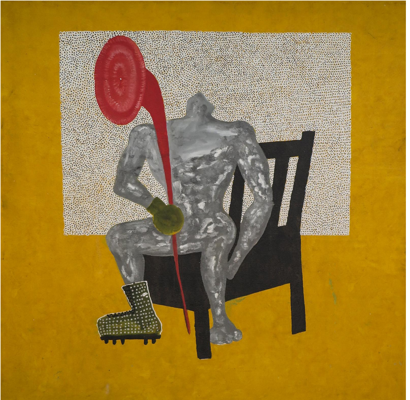
L'observateur perdu, 2019

Acrylique sur toile - Acrylic on canvas, 190 x 190 cm - 74,8 x 74,8 in