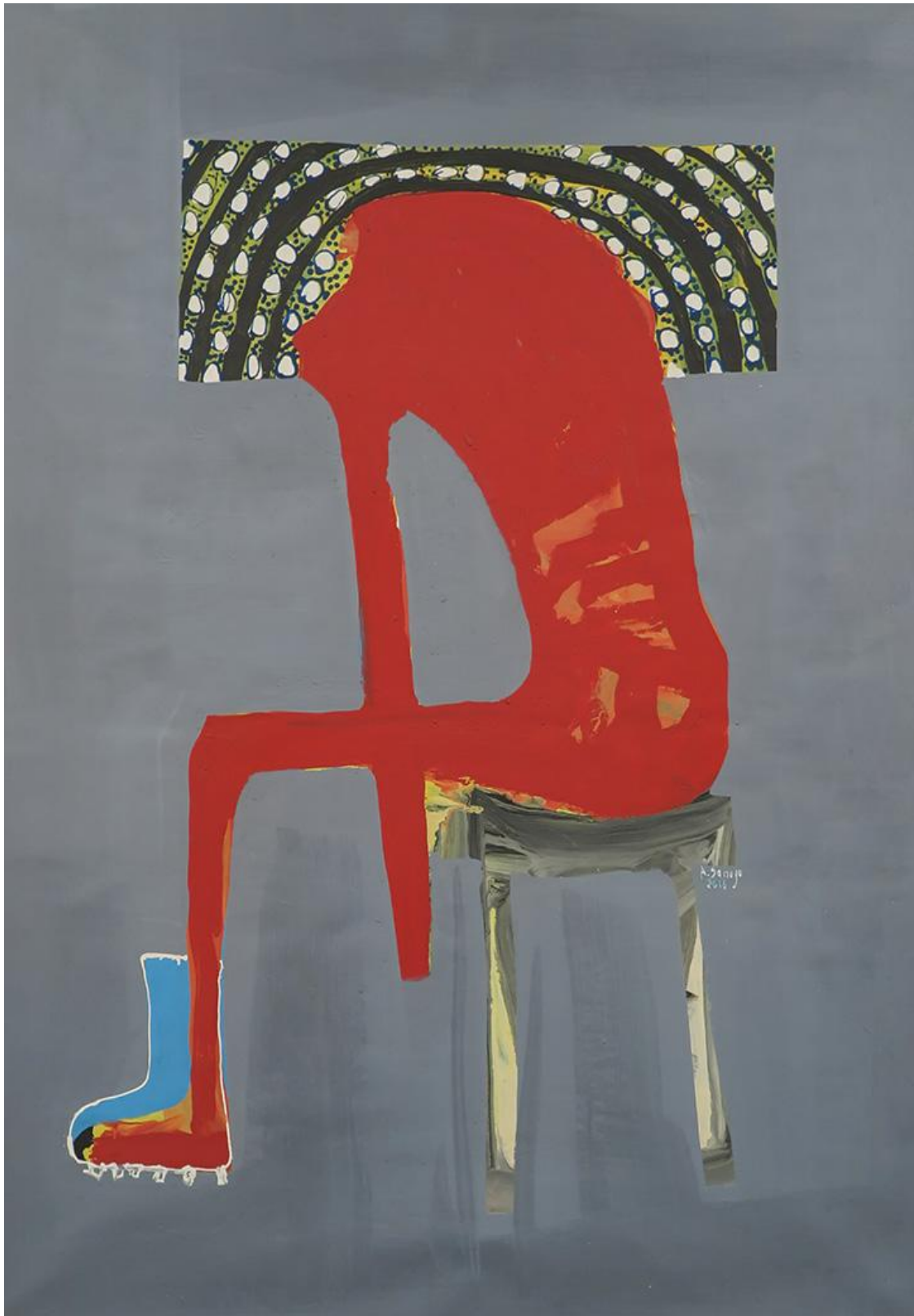
Sans tête (épuisé) , 2016

Acrylique sur toile - Acrylic on canvas, 147 x 112 cm - 57,9 x 44,15 in