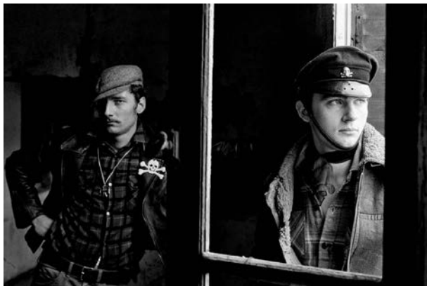
Blousons noirs de Yan Morvan dans "Le mois de la photo" Corbeil-Essonnes

Début du grand événement du Mois de la photo qui, cette année, ne se limite pas à la capitale mais s'étend au Grand-Paris. Certaines expos ont déjà commencé, d'autres le font dès ce week-end. L'occasion de découvrir le travail sur les « Blousons noirs », dans les années 70, de Yan Morvan, dont le premier livre sur les rockers, Le Cuir et le Baston , était le début d'un long travail sur les gangs qui a duré près de quarante ans. C'est en plein air, à Corbeil-Essonnes, au square Crété. Et le 23 avril, programme spécial avec food-truck, visites des environs, etc. Programme complet : www.loeilurbain.fr et moisdelaphotodugrandparis.com