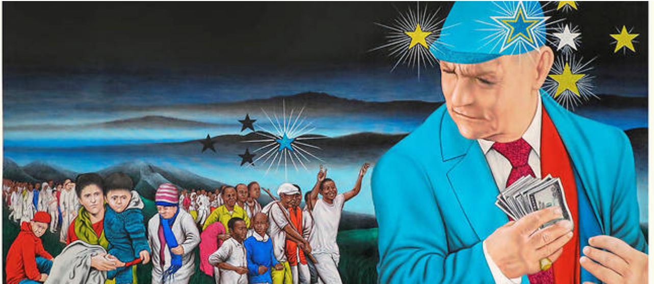
"Si toutes les étoiles brillaient" de Chéri Samba (2016) Galerie Magnin-A © Magnin

Par Brigitte Hernandez Publié le 31/03/2017