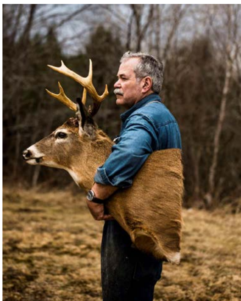
Le taxidermiste du Royaume dans le Vermont. Stéphane Lavoué, exposition à la galerie Fisheye, Paris © Stéphane Lavoue Stéphane Lavoue