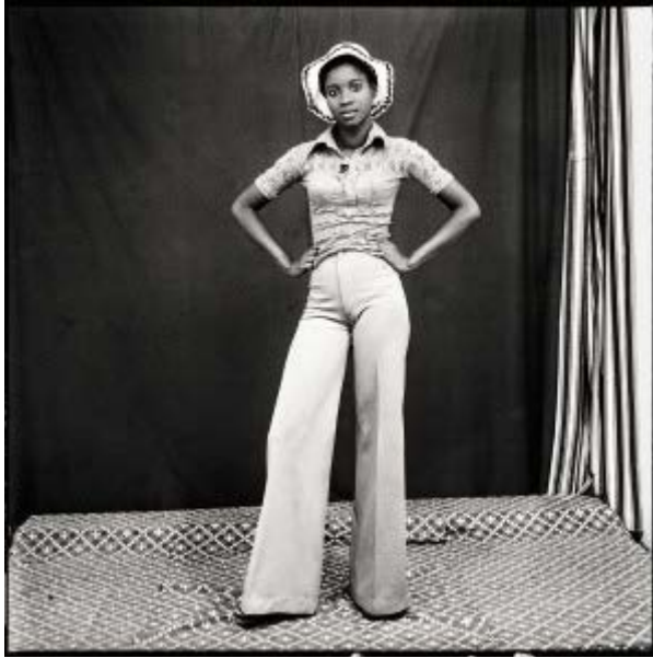
Malick Sidibé Mon chapeau et pattes d'éléphant, 1974 Tirage gélatino-argentique 60,5 x 50,5 cm Courtesy CAAC – The Pigozzi Collection, Genève © Malick Sidibé

L'apparente simplicité de la démarche de Sidibé s'érode au fur et à mesure de l'exposition, grâce à des photographies qui livrent non seulement le témoignage d'une époque, qui voit la récente indépendance du Mali, mais révèlent surtout les visages de ceux qui l'ont traversée. Malik Sidibé nous dit quelque chose d'eux, et de la photographie en général, à travers une vision rafraîchissante et profondément humaine.