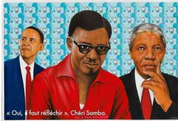
« Oui, il faut réfléchir », Chéri Samba.

« BEAUTÉ CONGO 1926-2015 CONGO KITOKO », du 11 juillet au 15 novembre, Fondation Cartier pour l'art contemporain, Paris-14*.