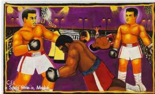
« Sans titre », Moké.