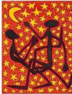
« Le Calendrier lunaire Luba », Mode Muntu.