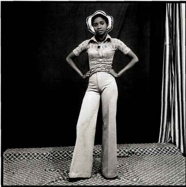
Ci-dessus, de haut en bas : "Un jeune gentleman" (1978) et "Mon chapeau et pattes d'éléphant" (1974). À droite : "Un gentleman en position" (1980). Trois photos signées Malick Sidibé.

PHOTOS COURTESY GALERIE MAGNIN-A. PARIS © MALICK SIDIBÉ ET COURTESY CAAC-THE PIGOZZI COLLECTION. GENÈVE © MALICK SIDIBÉ